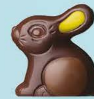
Praliné et éclats d'amandes caramélisées