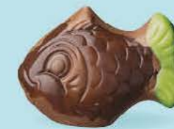
Praliné et noix de coco caramélisée