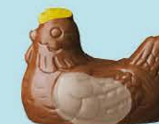
Duo praliné et ganache caramel