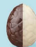
Praliné avec éclats de noisettes