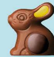
Praliné et riz soufflé