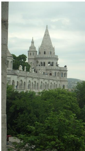
Bastion des pêcheurs